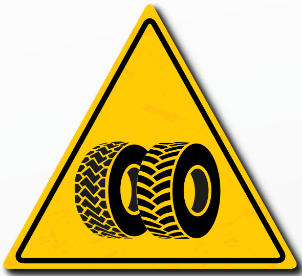
Pas uw banden aan naar gelang het type ondergrond