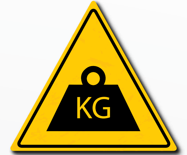
Respecteer de maximale capaciteit aangegeven op het laaddiagram