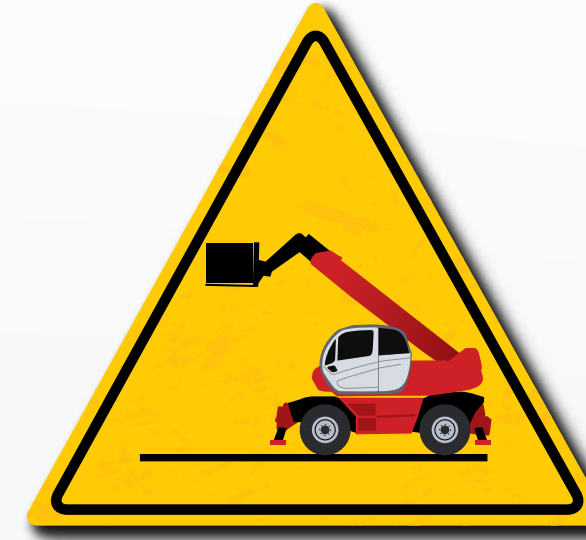
Laat de apparatuur met opgeheven lading niet met uitgeschoven arm staan