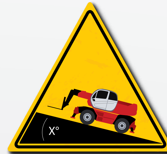
Wees op de hoogte van het hellingvermogen van de lading