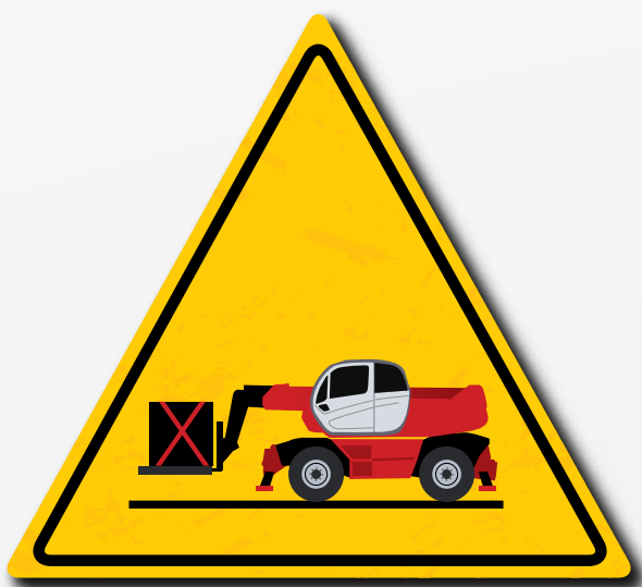
Vervoer de lading in een lage positie en met ingetrokken arm