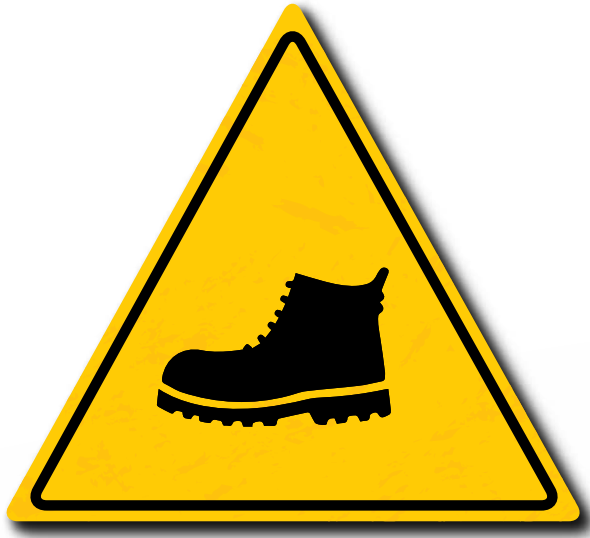
Gebruik van veiligheidsschoenen is verplicht