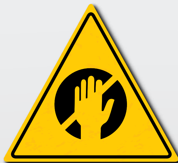
Let op objecten en stoffen, etc. die verstrikt kunnen raken in de machine.