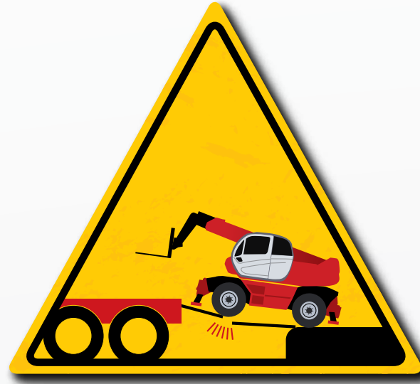
Controleer altijd de capaciteit van het laadgebied