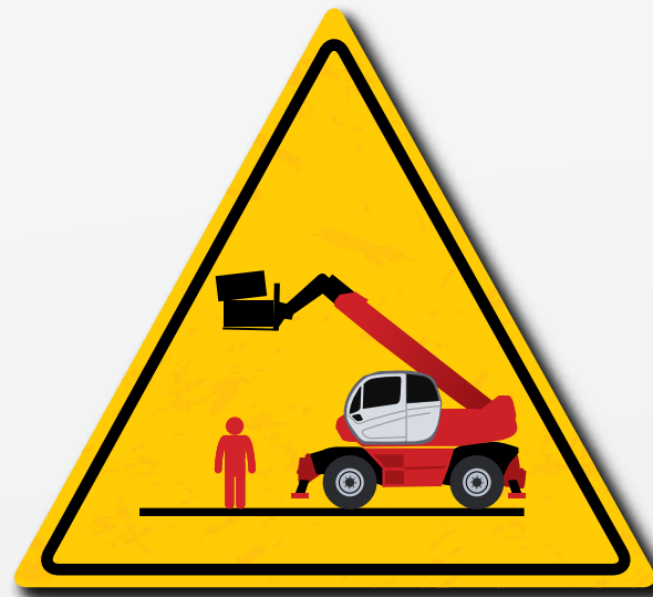
Loop nooit onder een opgeheven lading door