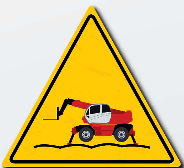
Let goed op de conditie van de ondergrond bij het gebruiken van de stabilisatoren