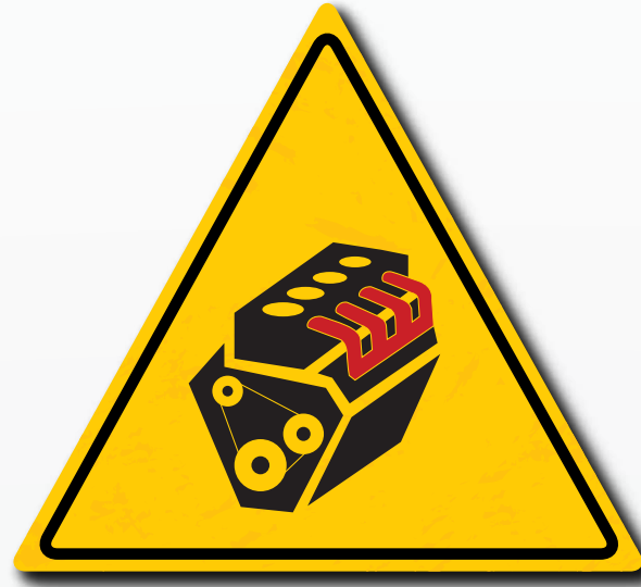
Laat de motor nooit aanstaan zonder bestuurder