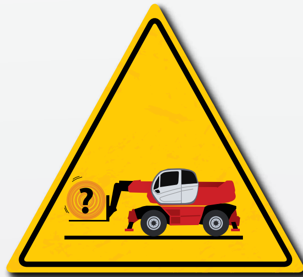
Gebruik accessoires die geschikt en vereist zijn voor de lading