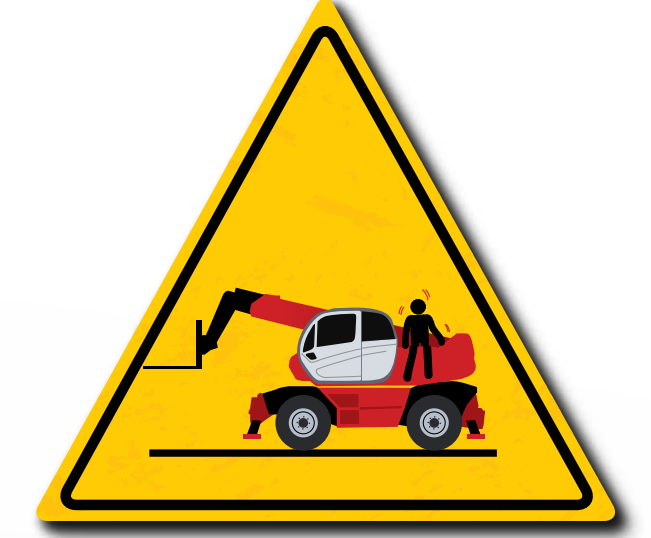
Neem geen passagiers mee