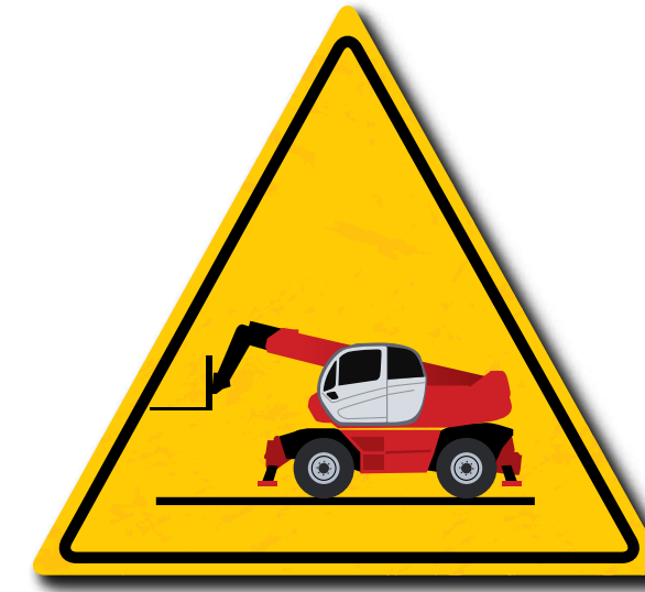
Controleer uw apparatuur voor gebruik

Het goed omgaan met apparatuur geeft ons een handvat om de werkomstandigheden te verbeteren. Het is de bedoeling van de Manitou Group om u door middel van hun programma Risico's verminderen te informeren en u bewust te maken van de juiste handelwijzen voor het veilig omgaan met uw apparatuur.