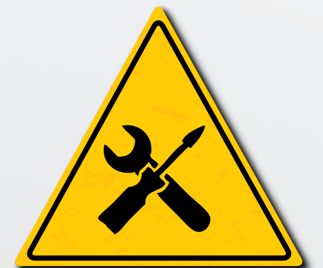
Periodiek onderhoud moet voldoen aan de wettelijke vereisten