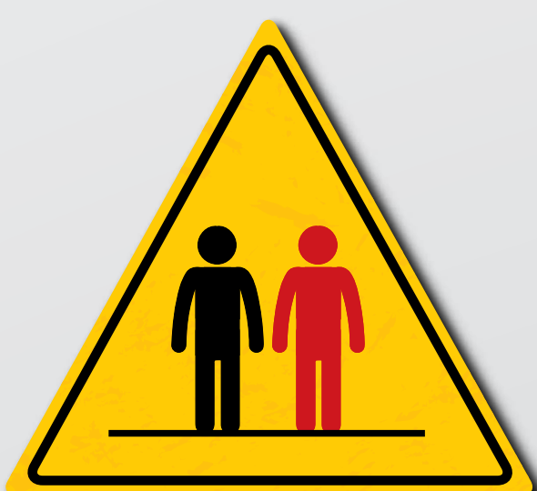
Wees op de hoogte van en houd u aan de wettelijke veiligheidseisen