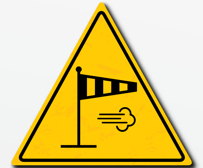
Let er op dat de windsnelheid niet hoger is dan 45 km/u