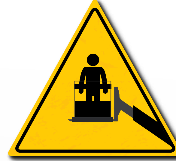
Het optillen van personen is alleen toegestaan met geschikte en gecertificeerde hoogwerkers