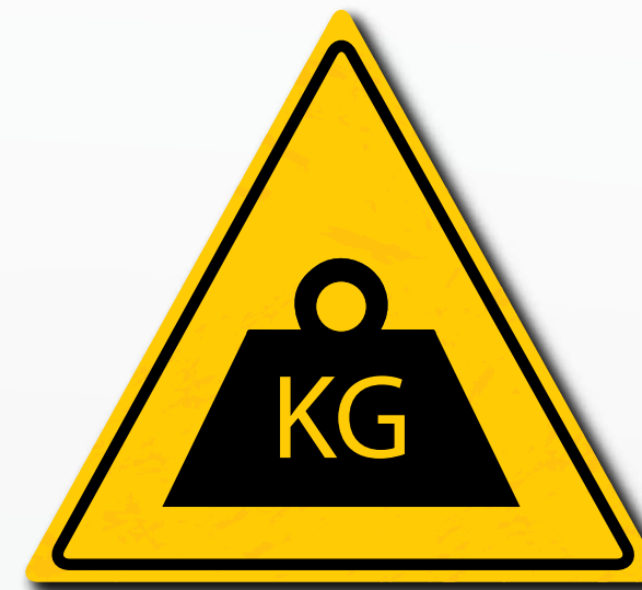
Respecteer de maximale capaciteit aangegeven op het laaddiagram