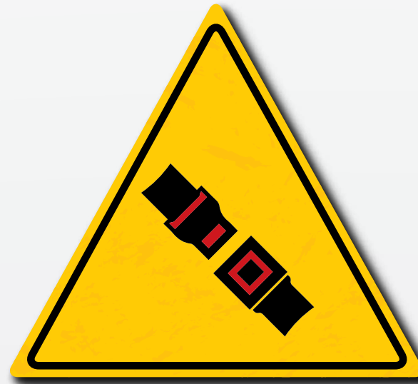
tijdens het gebruik van uw apparatuur is het gebruik van veiligheidsgordels verplicht