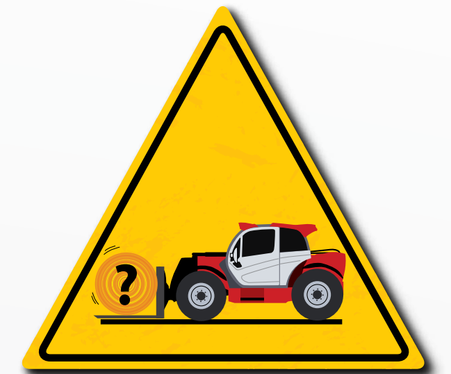
Gebruik accessoires die geschikt en vereist zijn voor de lading