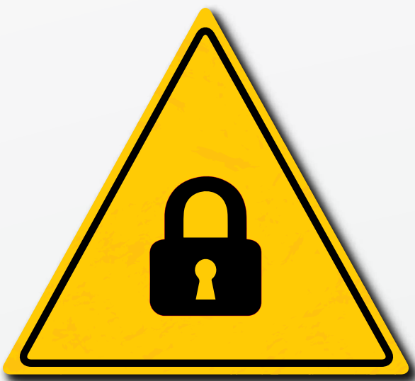
Zorg ervoor dat u de juiste bevestiging gebruikt voor uw accessoires