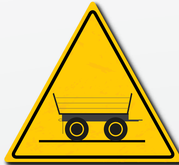
Wees op de hoogte van de wettelijke voorschriften bij het gebruik van een aanhanger