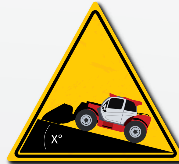
Wees op de hoogte van het hellingvermogen van de lading