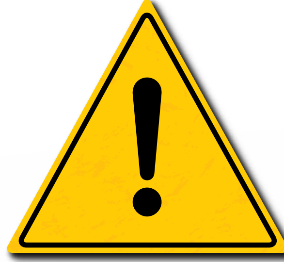
Let goed op uw werkomgeving om schade te voorkomen