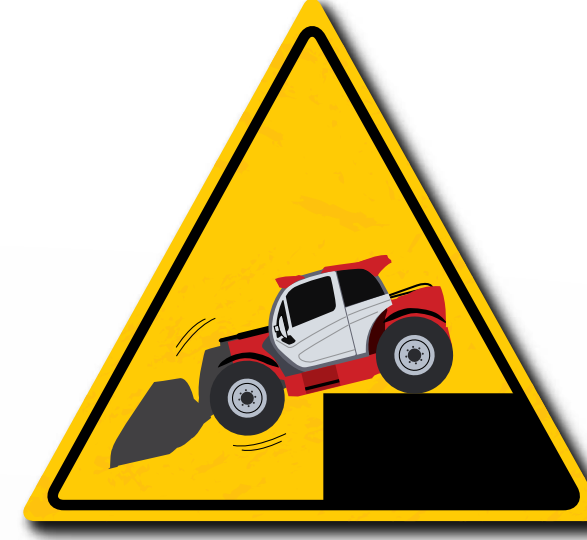
Houd een veilige afstand als u een gevaarlijk gebied nadert