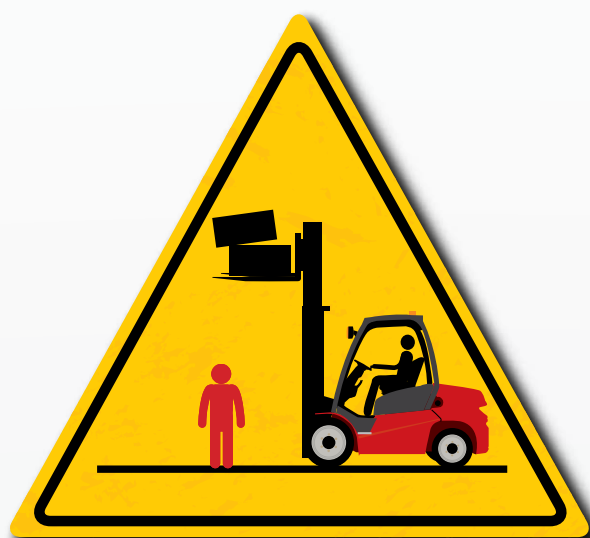
Mai camminare sotto carichi sopraelevati