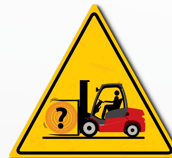
Utilizzare accessori idonei in base ai requisiti di carico