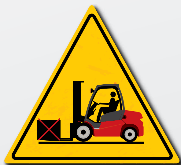
Accertarsi che il carico sia stabile e posizionato contro le forche