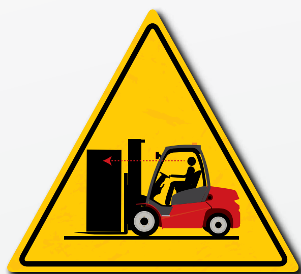
Adattare la direzione di guida in base alla visibilità