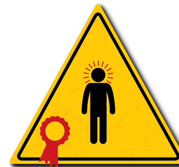
Solo le persone autorizzate possono usare le attrezzature