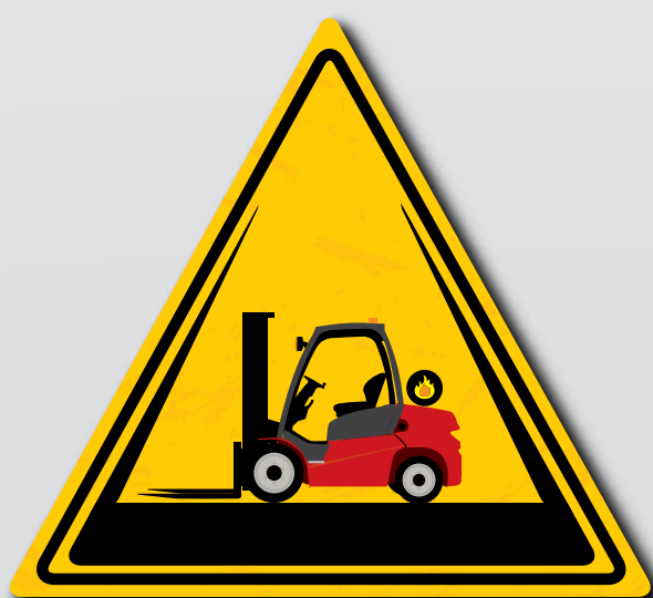
Mai lasciare il carrello elevatore a GPL in uno spazio confinato. Spegnerne sempre il gas