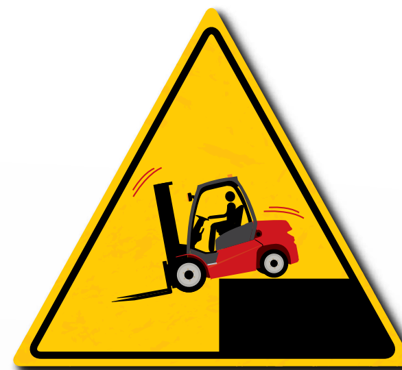
Mantenere una distanza di sicurezza quando ci si avvicina ad aree pericolose