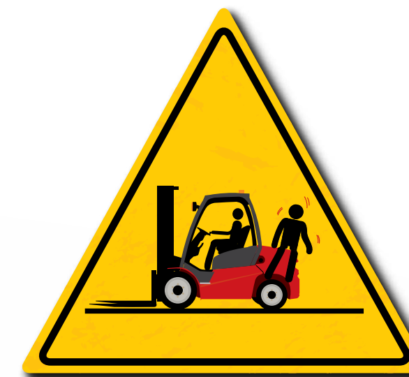
Non portare passeggeri