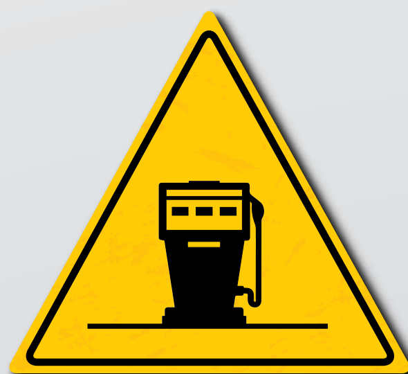
Effettuare i rifornimenti prestando la dovuta attenzione