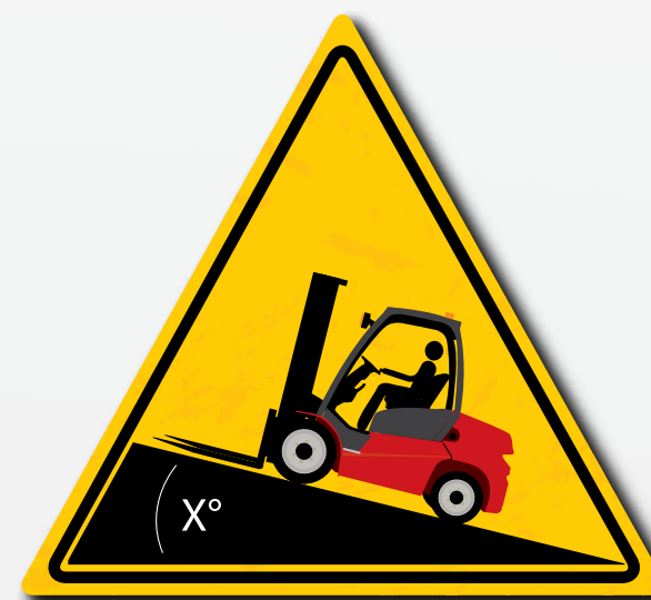
Prestare attenzione alle pendenze del carico