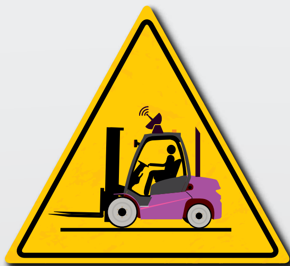
Mai apportare modifiche non autorizzate all'attrezzatura