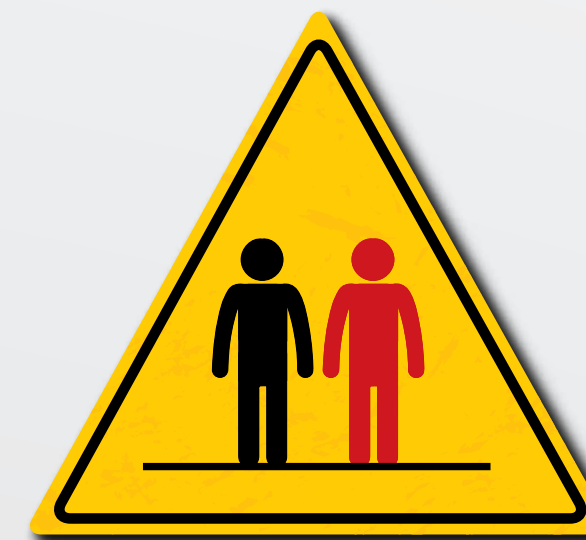
Prestare attenzione e ottemperare ai requisiti di legge in materia di sicurezza