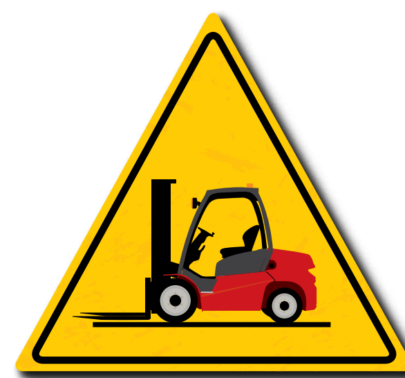
Controllare le attrezzature prima dell'utilizzo

Utilizzate correttamente, le attrezzature di movimentazione sono una risorsa che permette di migliorare le condizioni lavorative. Il gruppo Manitou desidera, attraverso il programma REDUCE Risks, informare gli operatori e sensibilizzare sulle buone pratiche per utilizzare le attrezzature in maniera sicura.