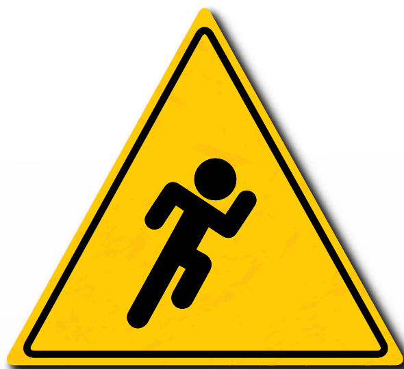
Essere pronti a reagire a situazioni inaspettate