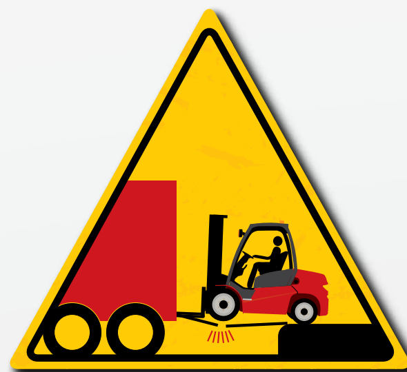
Controllare sempre la capacità di carico di piattaforme, banchine, portali ecc.