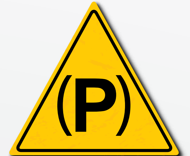
Beachten Sie beim Parken die Sicherheitsregeln