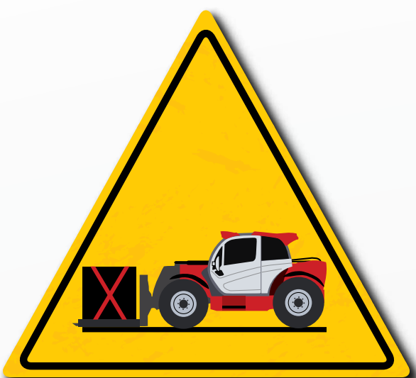
Die Last in einer niedrigen Position und mit eingefahrenem Ausleger befördern