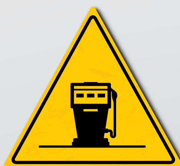
Beim Tanken Vorsicht walten lassen