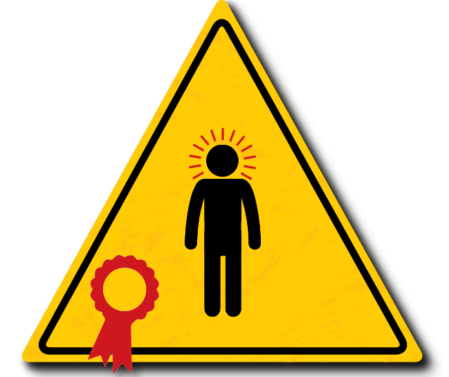
Der Gebrauch der Ausrüstung ist nur autorisierten Personen gestattet