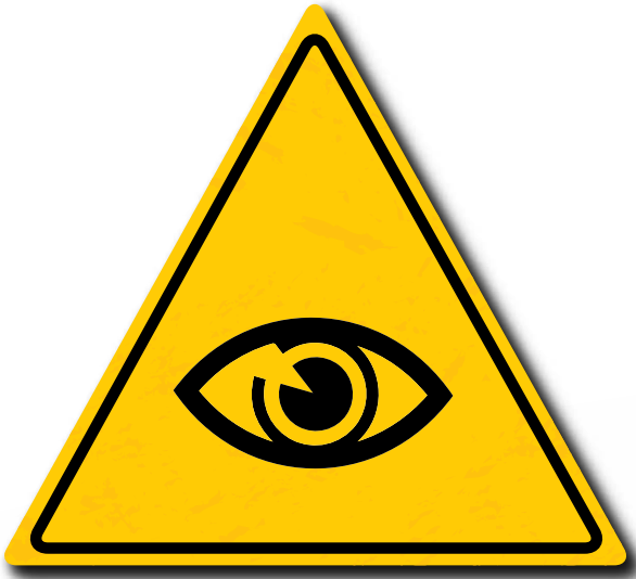
Achten Sie darauf, dass die richtige Fahrposition ausgewählt wird