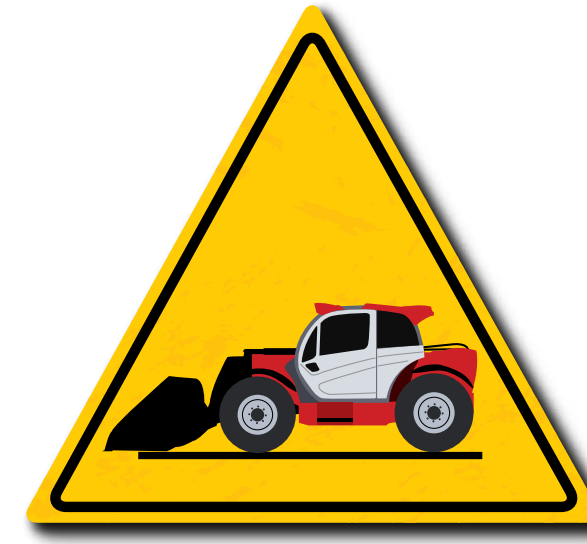
Überprüfen Sie Ihre Ausrüstung vor dem Gebrauch

Die ordnungsgemäße Handhabung der Ausrüstung trägt zu mehr Arbeitssicherheit bei. Die Manitou Gruppe möchte Sie über ihr Programm „REDUCE Risks“ informieren und Sie auf die bewährten Verfahren zum sicheren Gebrauch Ihrer Ausrüstung aufmerksam machen.