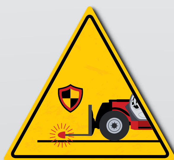
Schützen Sie alle hervorstehenden Teile beim Fahren auf der Straße