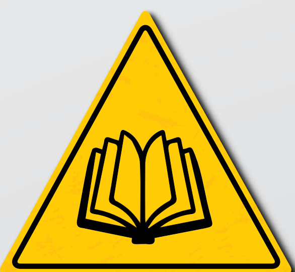
Lesen Sie die Anweisungen im Bedienerhandbuch