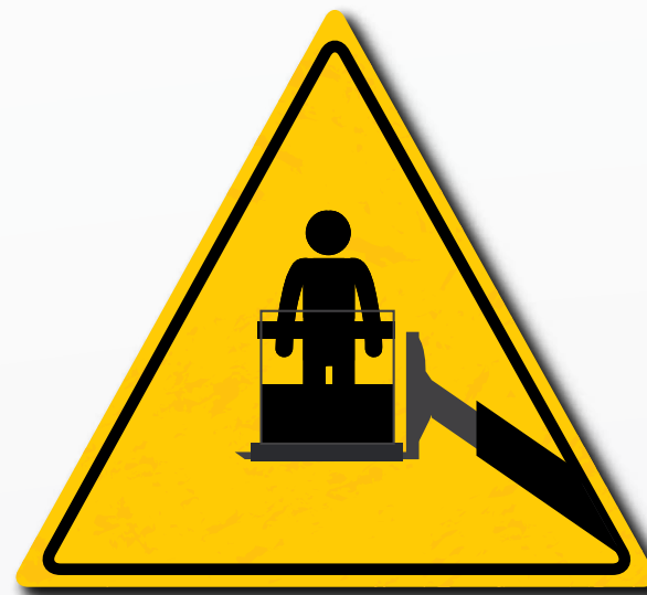
La elevación de personas sólo se permite con plataformas adecuadas y certificadas