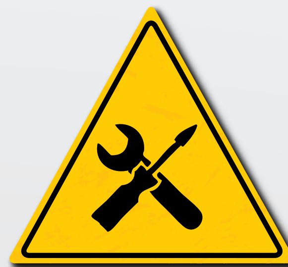
El mantenimiento periódico debe ajustarse a los requisitos legales