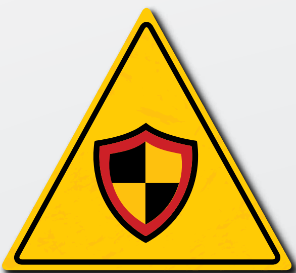
No corte nunca los sistemas de protección y seguridad