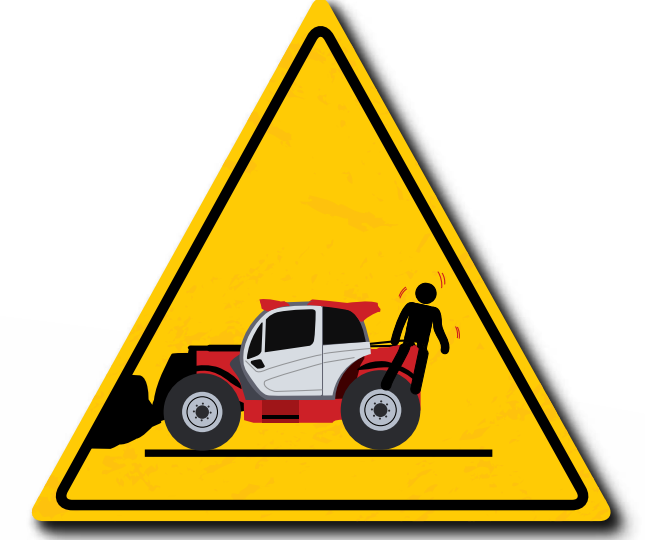
No se admiten pasajeros