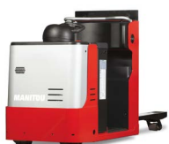
Modèle CI Optimisez votre logistique grâce à des préparateurs de commandes allant jusqu'à 2 tonnes.

Notre nouvelle gamme offre une autonomie complète pour vos opérations de manutention dans les secteurs de l'industrie et de la logistique : préparation de commandes, transport de marchandises, chargement/déchargement de camions, alimentation de lignes de production. Faciles à installer, les machines s'adaptent à l'environnement de votre entrepôt, avec des capacités de détection et de suivi des personnes sans étiquette. L'analyse des données en temps réel améliore encore davantage l'efficacité des opérations.