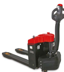
Modèle EP Transpalettes électriques d'une capacité de 1,5 à 5 tonnes.