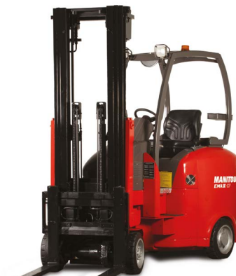
Modèles ER et EMA Nos gammes ER et EMA, d'une capacité allant jusqu'à 2 tonnes, sont conçues pour répondre à vos besoins logistiques les plus exigeants en offrant une compacité inégalée dans les allées étroites et des hauteurs de levage allant jusqu'à 12 mètres.