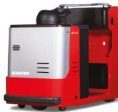
Modèle CT Remorquage de 3 à 5 tonnes.