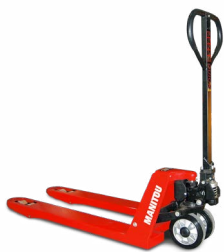
Modèle EH Transpalette manuel pour les transferts quotidiens de base.